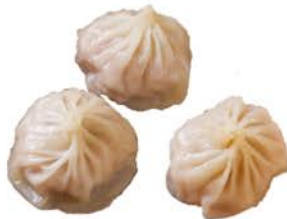
47 Xiao long bao