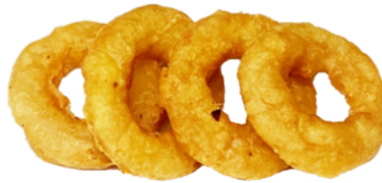
63 Calamares fritos