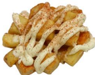
52 Patatas bravas con salsa alioli