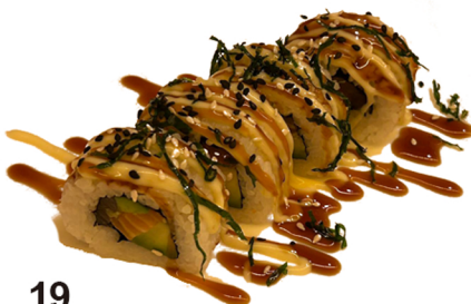
19 Uramaki de salmón y aguacate