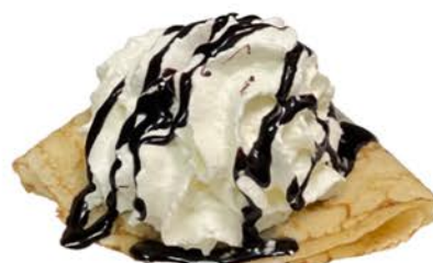
121 Crep de nocilla con nata y chocolate Alérgeno:1. 3. 7 2.95€