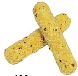
106 Queso frito