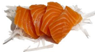
112 Sashimi de salmón