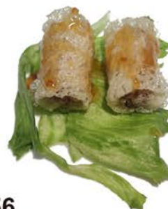
56 Rollitos de verano