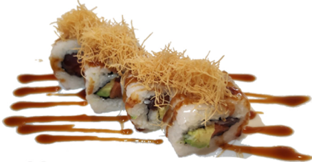
28 Uramaki medio frito de salmón y aguacate