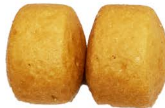
53 Pan chino