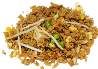
65 Arroz de la casa