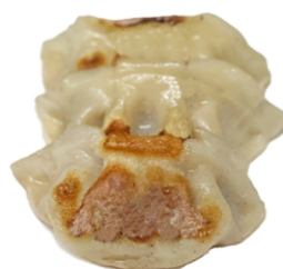
77 Gyozas de pollo y verduras a la plancha CONTIENE GLUTEN SOJA CARIOS DE SESAMO 4,75€ (4U)