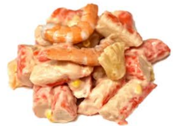
6 Ensalada cangrejo, piña y gambas