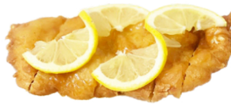
61 Pollo con salsa de limón