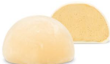
124 Mochi de mango y maracuyá Alérgeno:1. 3.7.8 2.95€