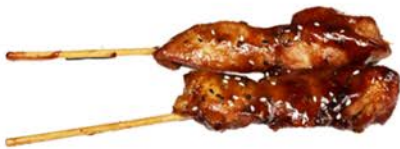
62A Brochetas de pollo con salsa japonesa