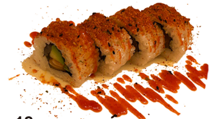
18 Uramaki de salmón y aguacate con salsa picante