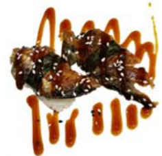
110 Nigiri de anguila