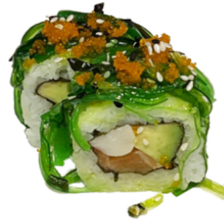
26 Uramaki de surimi, aguacate y salmón con wakame