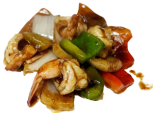
73 Gambas con salsa sacha CONTIENE GLUTEN CRUSTACEOS SOJA 8,95€