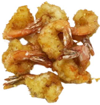
57 Langostinos empanados con sésamo