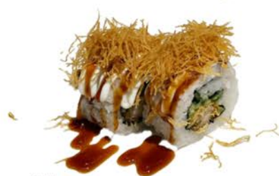
17 Uramaki medio frito con tempura de gamba y pepino