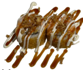
14 Tempura uramaki con gambas