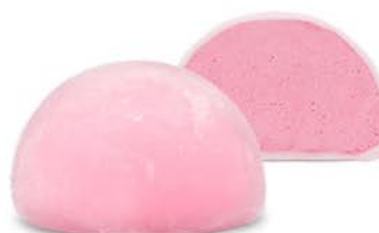
125 Mochi de cereza Alérgeno:1. 3.7.8 2.95€