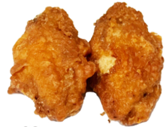
62 Alitas de pollo