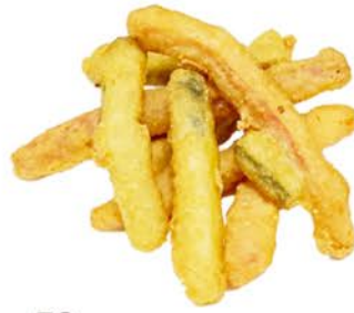
58 Tempura de verduras