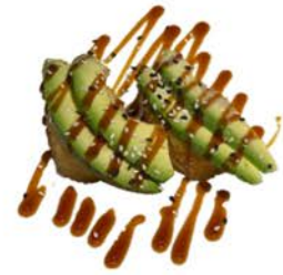
12 Tempura uramaki con aguacate