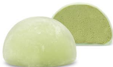
126 Mochi de té verde Alérgeno:1. 3.7.8 2.95€