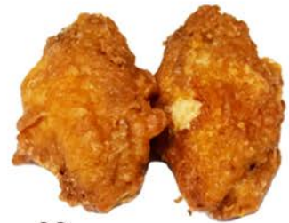
62 Alitas de pollo