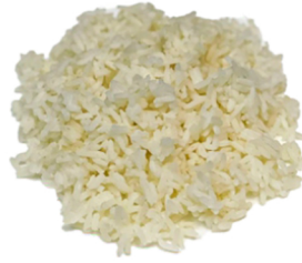
68 Arroz blanco 1,95€