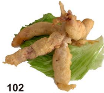
102 Tempura de rejos de calamar