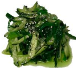
4 Ensalada wakame