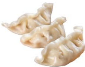
46 Gyozas de carne y verduras