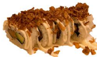
20 Uramaki de aguacate y salmón con cebolla frita