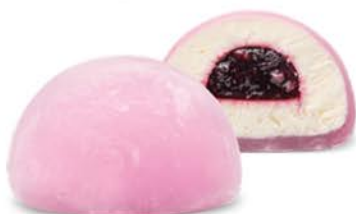
122 Mochi de tarta de queso Alérgeno:1. 3.7.8 2.95€