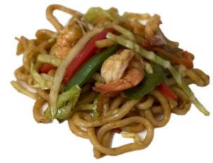
69 Tallarines udon CONTIENE GLUTEN CRUSTACEOS HUEVOS SOJA CARIOS DE SESAMO 6,45€