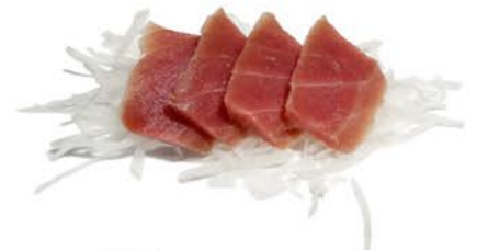
113 Sashimi de atún