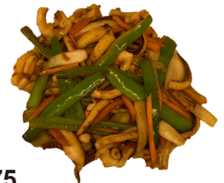
75 Rejos de calamar con salsa sacha CONTIENE GLUTEN SOJA MOLUSCOS 7,95€