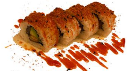
18 Uramaki de salmón, atún y aguacate con salsa picante