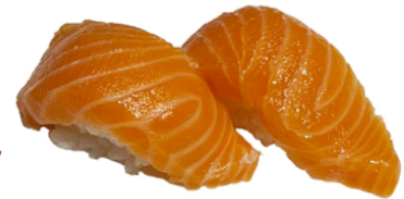
30 Nigiri de salmón