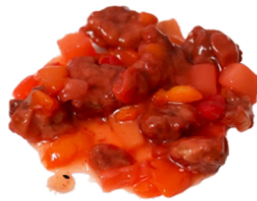
71 Cerdo agri dulce CONTIENE GLUTEN CARIOS DE SESAMO 6,95€