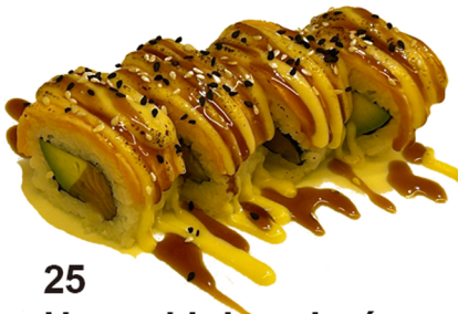
25 Uramaki de salmón flameado con atún y aguacate