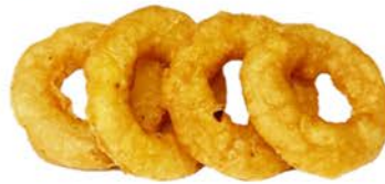
63 Calamares fritos