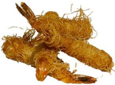
104 Tempura de langostinos