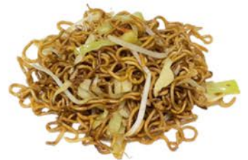
66 Tallarines con verduras