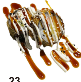
23 Tempura uramaki