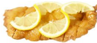
61 Pollo con salsa de limón