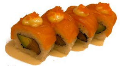
15 Uramaki de salmón y aguacate con mostaza