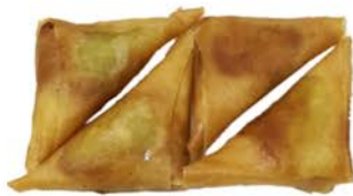
60 Samora con curry