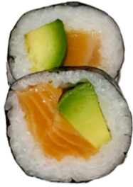
22 Maki de aguacate y salmón