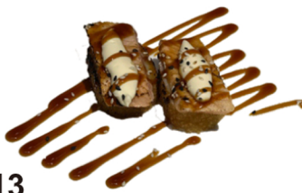
13 Tempura uramaki con salmón flameado