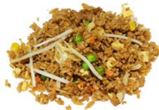
65 Arroz de la casa