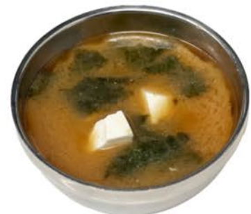
9 Sopa de miso