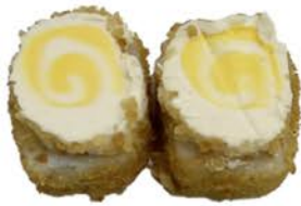
10 Tempura uramaki con queso y piña