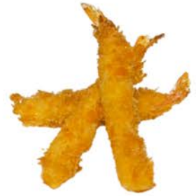
103 Tempura de langostinos