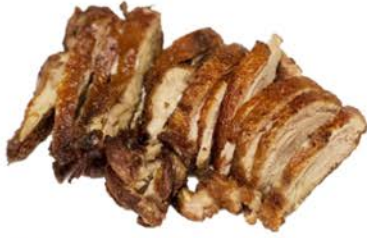
101 Pato frito con salsa teriyaki