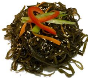
5 Ensalada de alga marina