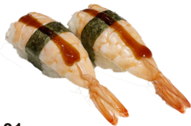
31 Nigiri de langostino