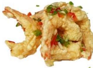
105 Langostinos con salsa pimienta