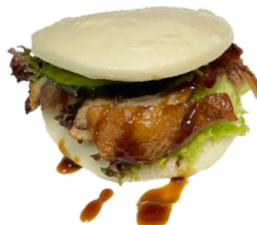
74 Bao relleno de pato y lechuga CONTIENE GLUTEN HUEVOS SOJA LACTICOS 3,50€