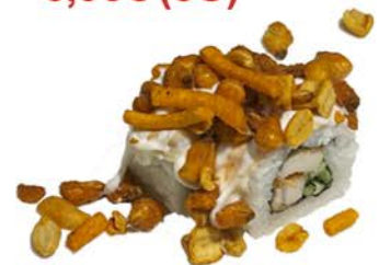
21 Uramaki de pollo frito y pepino con frutos secos