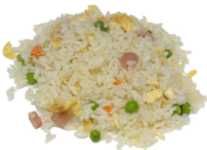
64 Arroz frito