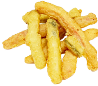
58 Tempura de verduras