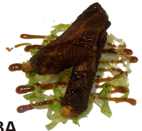
63A Costillas con salsa teriyaki