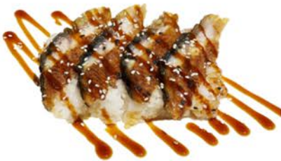
111 Sushi de arroz con anguila