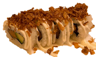
20 Uramaki de aguacate y atún con cebolla frita