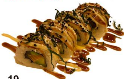
19 Uramaki de salmón, atún y aguacate