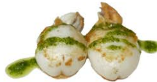
108 Sepia a la plancha