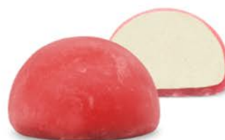
123 Mochi de fresa Alérgeno:1. 3.7.8 2.95€