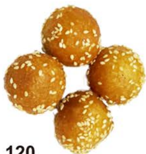
120 Bolas de sésamo fritos 4U Alérgeno:1. 11 2.95€