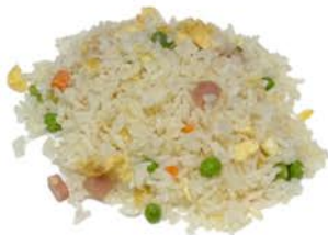
64 Arroz frito