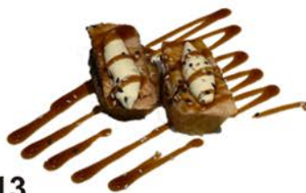
13 Tempura uramaki con salmón flameado