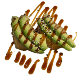
12 Tempura uramaki con aguacate