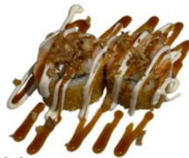
14 Tempura uramaki con gambas