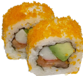
16 Uramaki de huevo con surimi, aguacate y salmón