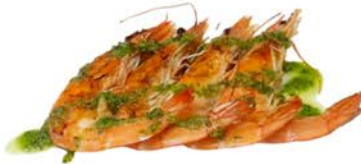
107 Gambón a la plancha