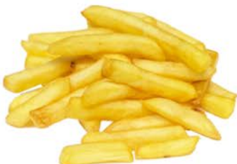
51 Patatas fritas