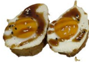
11 Tempura uramaki con huevo de codorniz