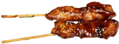
62A Brochetas de pollo con salsa japonesa