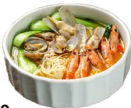
49 Sopa de udon con mariscos