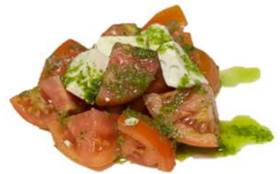
3 Ensalada tomate y queso