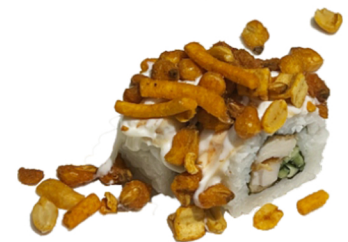
21 Uramaki de pollo frito y pepino con frutos secos