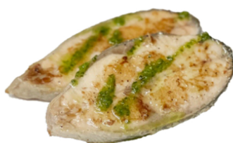
76 Salmón a la plancha PESCADO 6,95€