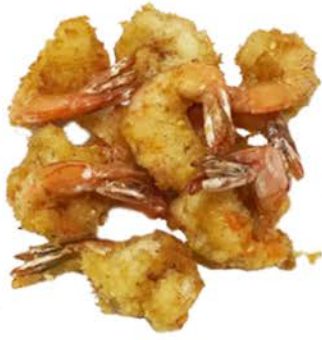
57 Langostinos empanados con sésamo