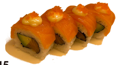
15 Uramaki de atún y aguacate con salmón y mostaza