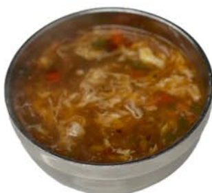
7 Sopa agripicante