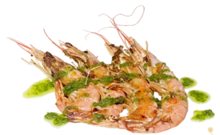
78 Langostinos a la plancha CRUSTACEOS 8,95€ (8U)