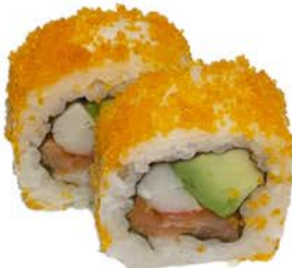
16 Uramaki de hueva con surimi, aguacate y salmón