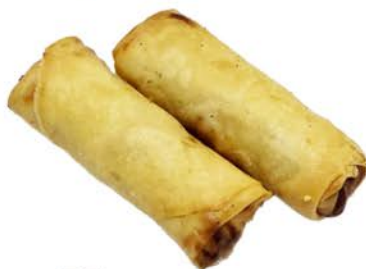
55 Rollitos de verduras