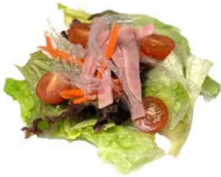
1 Ensalada Asia