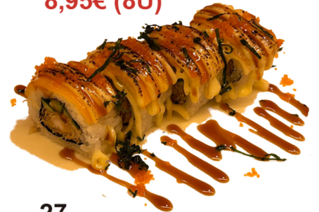
27 Uramaki de tempura de gambas, pepino y queso flameado