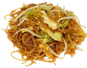
67 Fideos de arroz CONTIENE GLUTEN CRUSTACEOS HUEVOS SOJA CARIOS DE SESAMO 6,95€