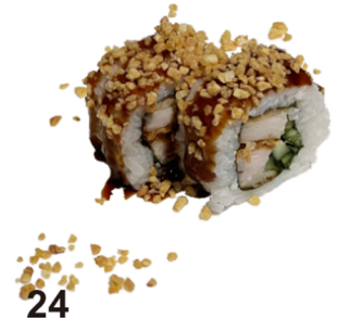
24 Uramaki de pollo frito y pepino con almendras