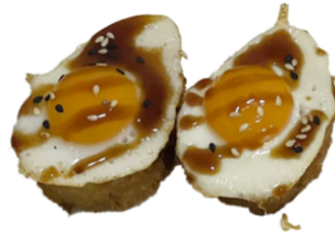
11 Tempura uramaki con huevo de codorniz