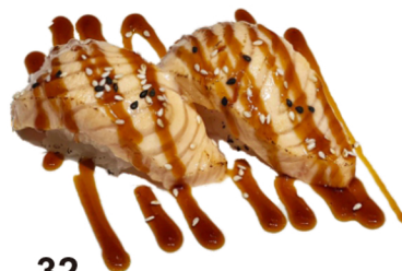
32 Nigiri de salmón flameado