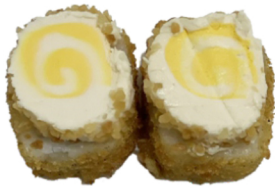
10 Tempura uramaki con queso y piña