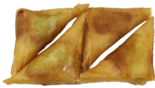
60 Samora con curry