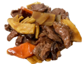
72 Ternera con salsa japonesa CONTIENE GLUTEN SOJA 7,95€