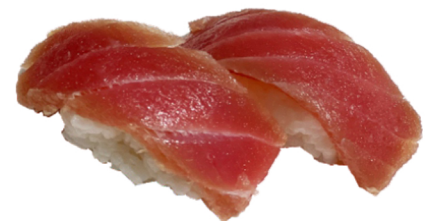
33 Nigiri de atún