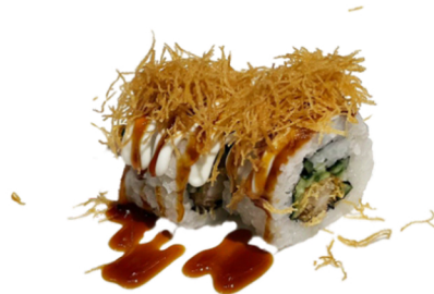
17 Uramaki medio frito con tempura de gamba y pepino