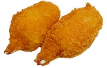
59 Muslitos de cangrejo