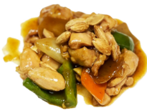
70 Pollo con almendras CONTIENE GLUTEN SOJA FRUTOS DE CÁSCARA 7,50€