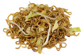
66 Tallarines con verduras