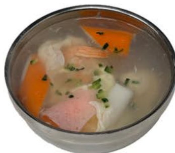
8 Sopa de marisco