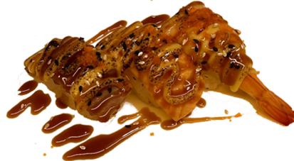
29 Combo de nigiris flameados con queso