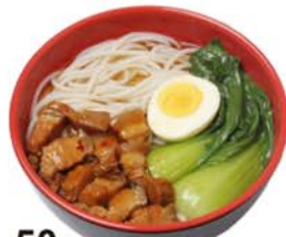
50 Sopa de ramen con carne